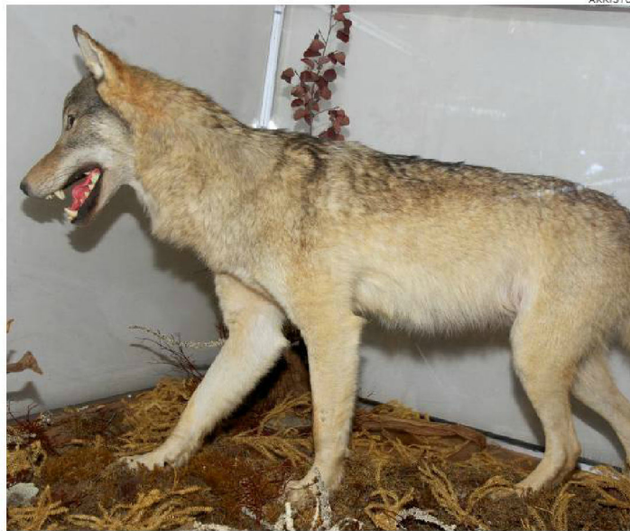
Isojoella 1978 kaadettu kookas susi. Pyöreäpäiset korvat, pitkä kuono suhteessa kalloon, mustat raidat etujaloissa, isot tassut, kaikki kynnet pikimustat, musta hännänpää.