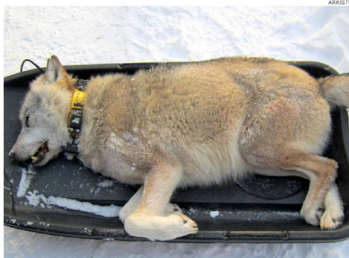
Pantasusi Auli 2012. Hybridin tunnusmerkkejä. Jyrkkä otsapenger, tylppä ja pyöreä kuonopää, vaaleat posket, pienet korvat ja koiran talviturkki, vaalea häntätupsu.

mesta Venäjän tiedeakatemi-an Vavilov-instituuttiin. Kyseinen instituutti on maailman suurin ja Venäjän arvostetuin sudentutkimuslaitos.